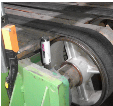
Die Lager der Transportbänder in einer Wellkartonfabrik werden kontinuierlich mit dem simalube Schmierstoffgeber geschmiert.