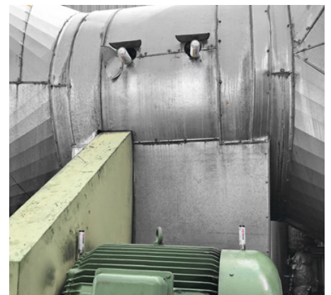
Schmierung der Lager einer Lüftungsanlage mit simalube 125 ml und 15 ml.