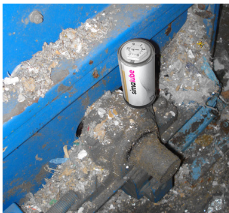
In einer Papierfabrik wird das Stehlager eines Schredders mit einem simalube 125 ml geschmiert.

«Erhebliche Zeitersparnis und verbesserte Arbeitssicherheit dank automatischer Schmierung»