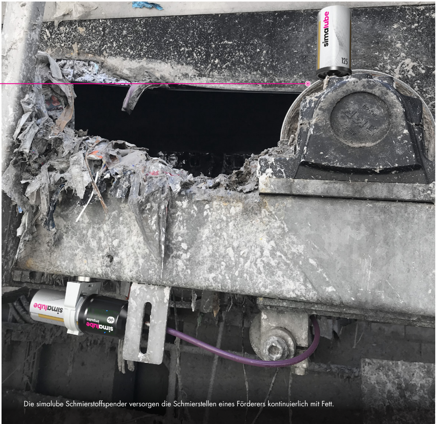
Die simalube Schmierstoffspender versorgen die Schmierstellen eines Förderers kontinuierlich mit Fett.